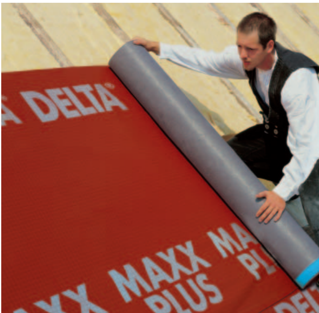
DELTA®-MAXX PLUS Energiebesparend membraan is makkelijk verlegbaar.