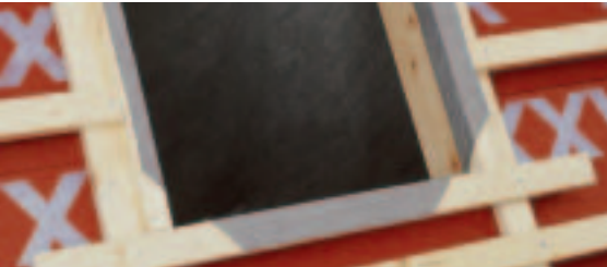
Detail van een plaatsing van een dakvenster.