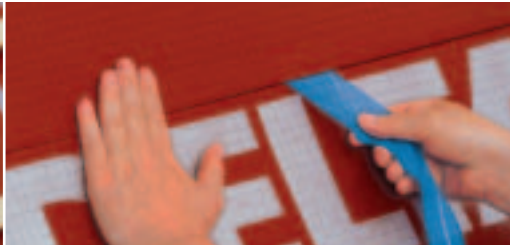
Goed aandrukken bij het verkleven van de overlapping.