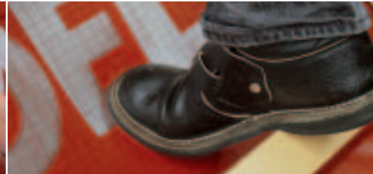
Optimale scheurvastheid bij het betreden van het dak.